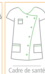
Cadre de santé